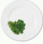
1/4 வட்டத் தட்டு* சமைத்த காய்கறிகள்