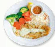
எக்கனாமிக் ரைஸ் (மீன் மற்றும் காய்கறிகள்)