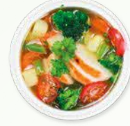
கொழுப்பற்ற கோழி மற்றும் காய்கறி சூப்