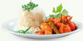
சோறுடன் காய்கறி கறி