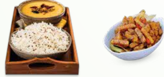
டெம்ப்பே மற்றும் துவரை காய்கறி கறியுடன் சாதம்