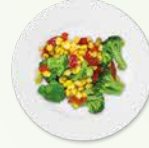
100 கிராம் சமைக்கப்படாத இலையில்லாத காய்கறிகள்