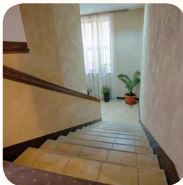
Reka bentuk dan laluan tangga yang tidak elok