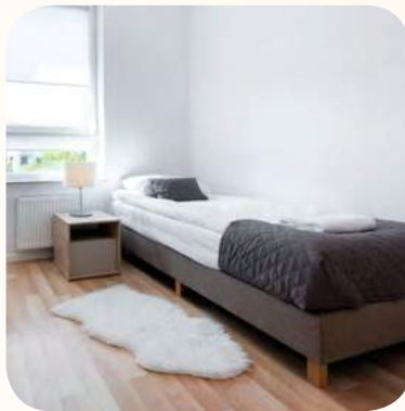
Permaidani atau alas lantai yang licin