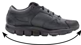
Kasut dengan tapak melengkung