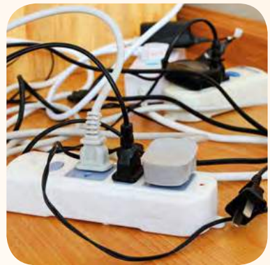
Kord atau wayar yang tidak dikemas rapi