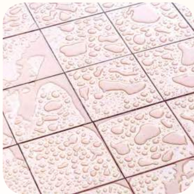
Lantai yang licin