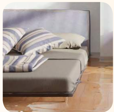
Kerusi dan katil yang terlampau tinggi atau rendah