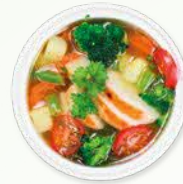
Ayam tanpa lemak dan sup sayur-sayuran