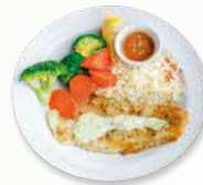
Nasi campur (ikan dan sayur-sayuran)