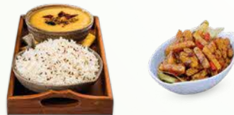
Tempeh dan kecacang, Kari sayur-sayuran dan Nasi