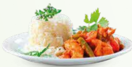
Kari sayur-sayuran dan Nasi