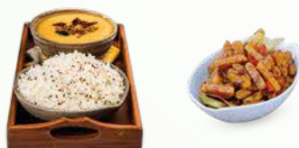
天贝(Tempeh)豆豉和扁豆 蔬菜咖喱配饭