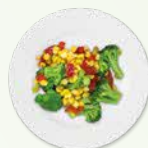
100 克生的 非叶类蔬菜