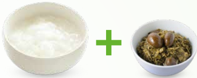
白粥配腌菜 和/或咸菜