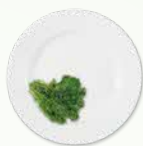
1/4 圆盘+ 煮熟的蔬菜